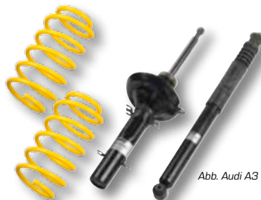
Abb. Audi A3