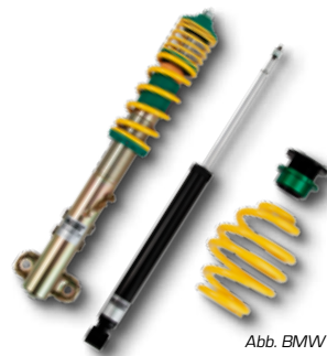
Abb. BMW E36