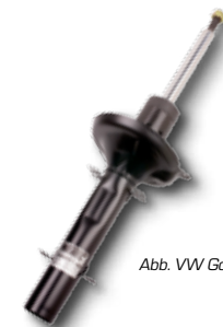
Abb. VW Golf IV