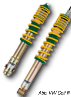
Abb. VW Golf III